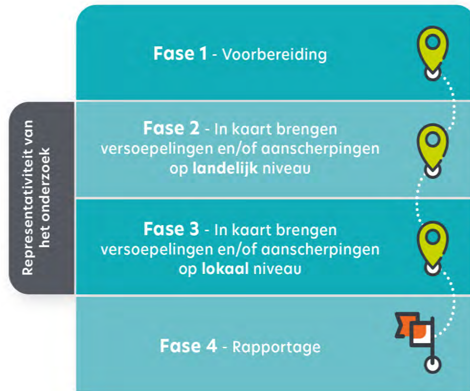
Figuur 2. Fasering van de onderzoeksmethodiek

Op basis van de uitkomsten van fase 1 zijn vragen opgesteld voor de interviews. In de 20 interviews is met landelijke uitvoeringsorganisaties, brancheorganisaties en beroepsverenigingen besproken welke versoepelingen en aanscherpingen van de regeldruk zij hebben ervaren, gezien en toegepast tijdens de coronacrisis, bijvoorbeeld als gevolg van maatregelen die tijdens de coronacrisis getroffen zijn. In de interviews is met name gesproken met (senior) beleidsmedewerkers en directieleden van de landelijke partijen. De lijst met betrokken organisaties is te vinden in bijlage B en een overzicht van deelnemers aan de groepssessies in bijlage C. Van de opgehaalde punten uit zowel het literatuuronderzoek als de interviews is het analysekader ingevuld met alle versoepelingen en aanscherpingen die naar voren zijn gekomen uit de gesprekken en de documentenanalyse, ingedeeld naar de verschillende sectoren. Dit vormt de input voor fase 3.